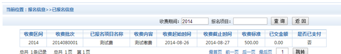
图 3.8-2 已报名信息

未注册用户，请点击首页的“新用户注册功能按钮”，阅读并同意报名须知，进入图 3.8-3 所示的报名界面。