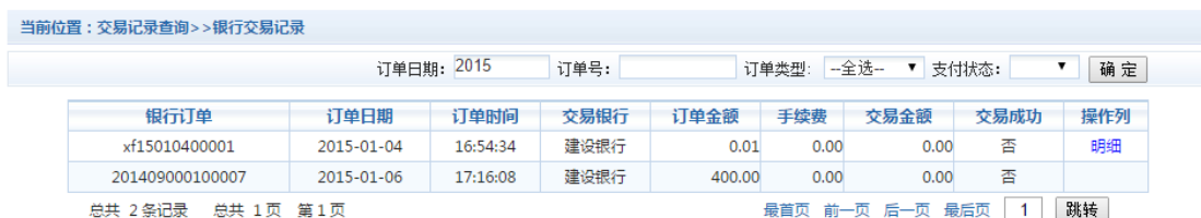
图 3.6-1 交易记录查询

点击导航栏的“交易记录查询”按钮，可以查询具体的银行交易记录。如图 3.6-1 所示。