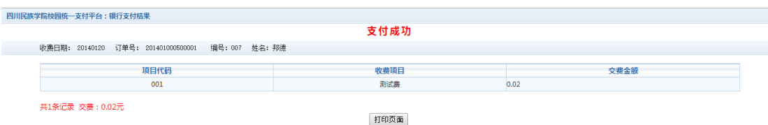
图 3.6-3 缴费凭证

若是其他缴费的订单，可以点击缴费凭证，查看和打印缴费凭证。如图 3.6-3 所示