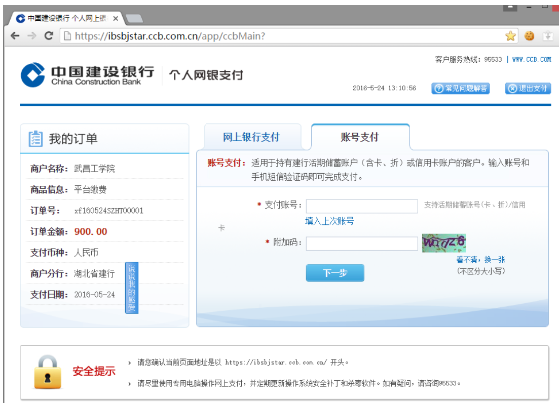
图 3.4-5 建设银行支付界面

建行网银支付，如图 3.4-5 所示，允许使用中银快付、网银支付等方式进行缴费。 注意：请确认商户名称为 武昌工学院，缴费地址以 https://ibsbjstar.ccb.com.cn 开始，金额与系统缴费金额一致后再缴费