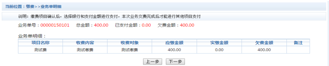
图 3.5-2 业务单费用确认