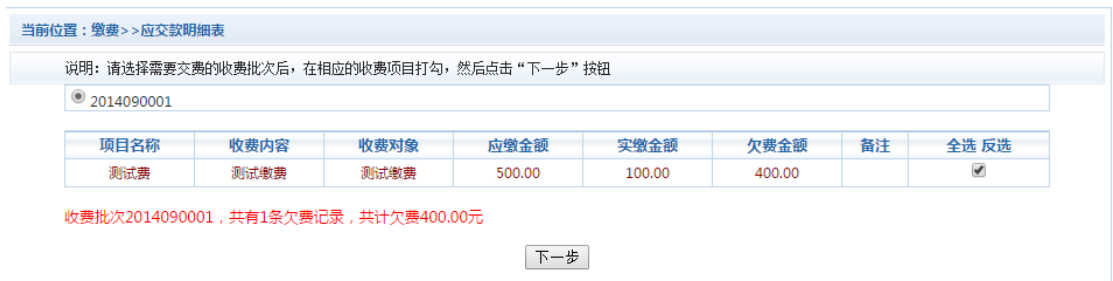
图 3.5-1 其他零星欠费

点击导航栏的“其他缴费”按钮，进入其他零星缴费显示和选择页面，如图 3.5-1 所示。