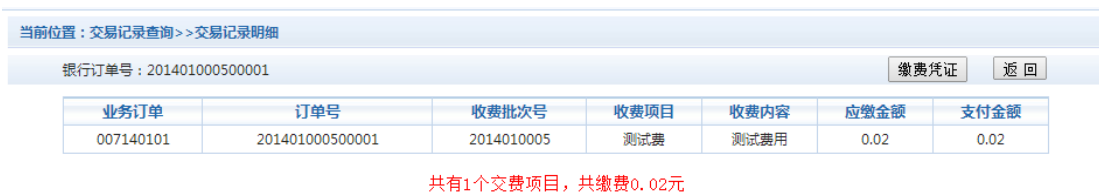
图 3.6-2 交易记录明细

若是其他缴费的订单，可以点击缴费凭证，查看和打印缴费凭证。如图 3.6-3 所示