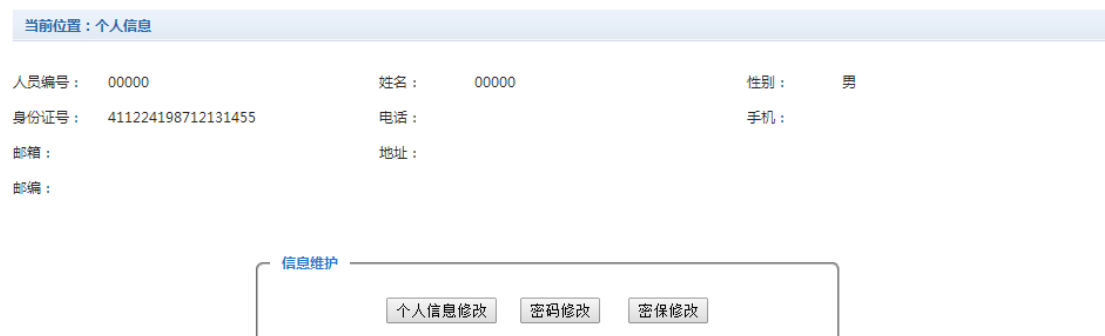
图 3.2-1 个人信息维护界面

登陆支付平台后，点击导航栏的个人信息按钮，显示个人信息确认及维护界面。如图 3.2-1 所示。 请确认个人信息无误后再进行缴费，避免误交费。