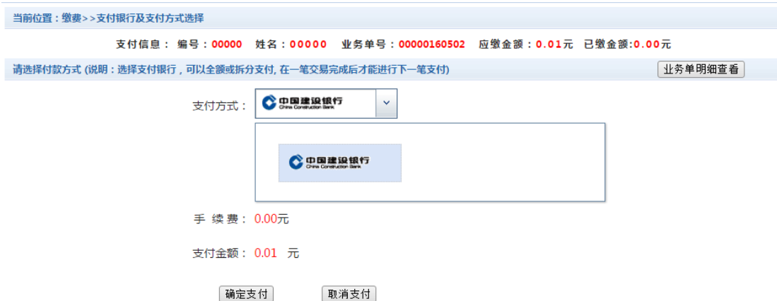
图 3.5-3 缴费信息及缴费方式选择