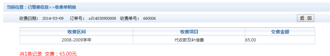
图 3.7.2 已缴费明细