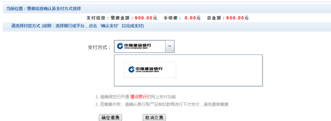
图 3.4-4 缴费方式选择