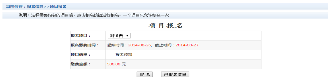
图 3.8-1 项目报名

已注册用户（包括在校生、其他使用过平台缴费的人员）可以登录支付平台，点击导航栏“报名信息”界面，选择报名项目，点击“报名”按钮进行报名。如图 3.8-1 所示