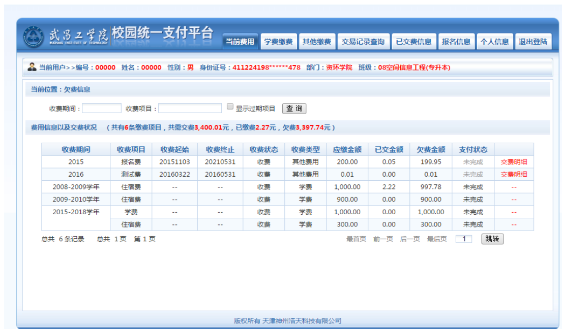
图 3.1-2 统一支付平台登陆后页面