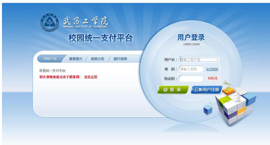
图 3.1-1 统一支付平台登陆界面

在浏览器地址栏输入 http://59.172.37.106 ，如图 3.1-1 所示。登陆之后显示个人欠费信息，如图 3.1-2 所示。